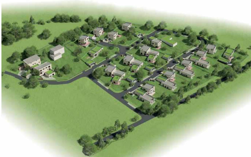
Vlastní developerský projekt Kopanský Mlýn

O. K.: Obvykle pracujeme pro komerční zadavatele a jejich podmínky jsou pro nás čitelné, jasné: víme, že projekt musí