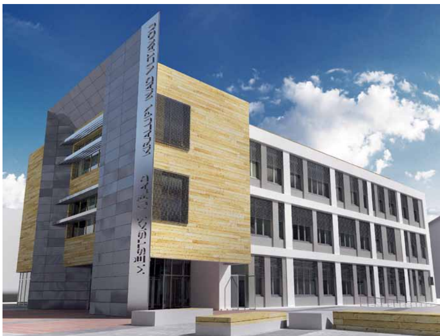
Radnice v Kralupech nad Vltavou – adaptace obchodního domu na městský úřad