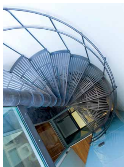
Točité schodiště ze surové oceli propojuje čtyři podlaží bytu Rostislava Říhy vzniklého ve zbytkovém prostoru vedle ateliéru.

a výtvarné řešení každé stavby. Jsme rádi, když se tyto dvě věci protnou. Nad projektem diskutujeme, hledáme různá řešení, probíráme se skicami a pak někoho napadne zlepšení, které druhého inspiruje ještě k dalšímu zlepšení a najednou to „ono“ řešení vznikne podobně, jako se z jednotlivých vrstev malby nakonec zrodí obraz. A to vzájemné ovlivňování mě na projektování baví nejvíc. Projekty jsou pak mnohem lepší, než kdyby je vymýšlel jen jeden z nás.