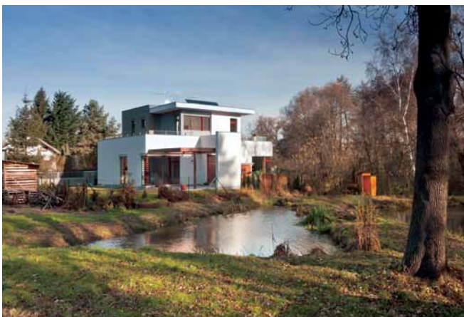
Víla v Nadýmači