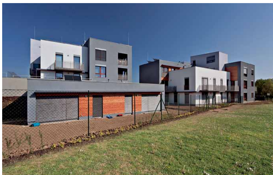
Bytové domy v Uhřetěbově

R. Ř.: Respektujeme přání a požadavky klienta, ale snažíme se i o komplexní