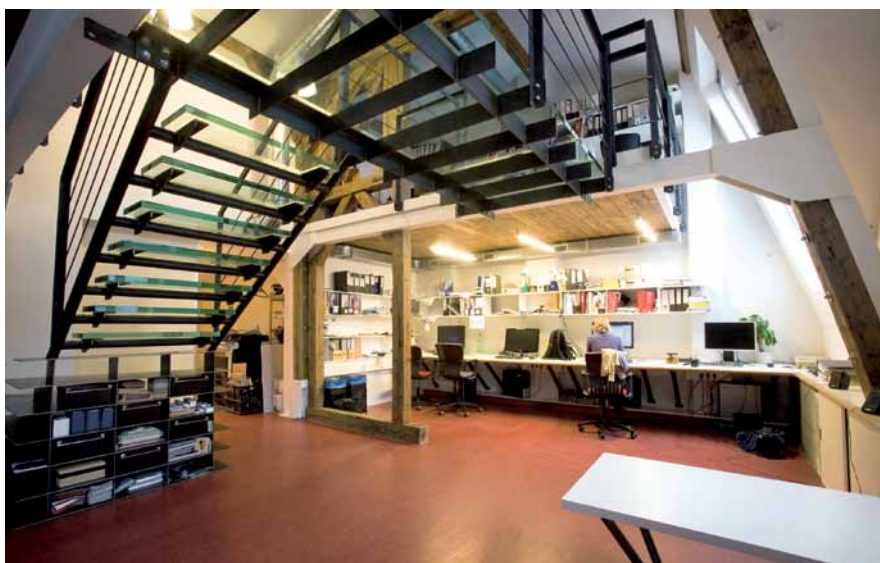
Vlastní ateliér v podkroví činžovního domu