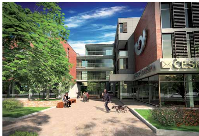
Občanská vybavenost v Praze-Čakovicích

Často jej ničí spíše ekonomické zájmy, které ho neberou v potaz, nebo nedomyšlená, chybějící či naopak přehnaná regulace ze strany úřadů.