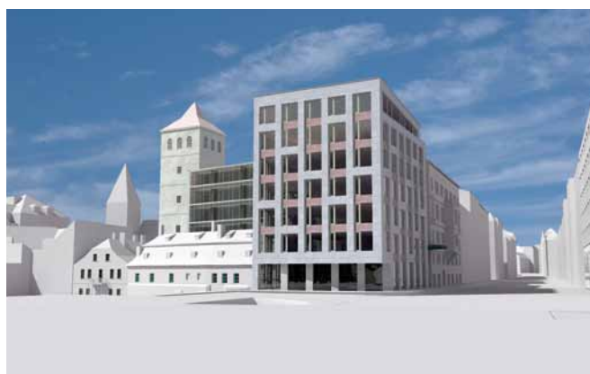
Studie domu v Lannově ulici v Praze

O. K.: Genia loci je třeba zachovávat, ale nové elementy jej nemusejí nutně zničit.